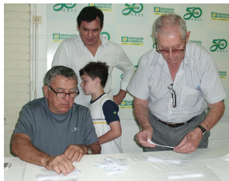
Momento da contagem dos votos