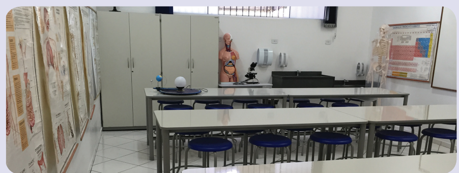
Laboratório de Ciências e Física

migo na Direção da escola, garante a excelência nos serviços oferecidos pelo Colégio Albert Einstein.